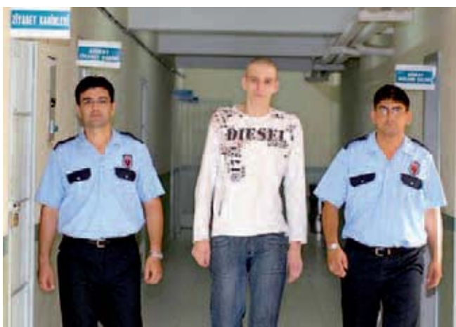
247 Tage lang musste der 17-Jährige – hier im Gefängnis in Antalya – in türkischer Untersuchungshaft verbringen.

Nun ließ sich das Gericht in Antalya von derlei Geklingel vorerst nicht aus der Ruhe bringen. Vermutlich aus Bockigkeit auf die Reaktion deutscher Politiker und um den Schein einer vermeintlich unabhängigen türkischen Justiz zu wahren, vertagt der türkische Richter Abdullah Yildiz jenseits europäischer Rechtsstandards unbeirrt den Prozess Monat um Monat („wegen Fluchtgefahr und der Schwere der Schuldvorwürfe “). Am Ende wird dem Mann der ganze Rummel zu viel: Um sich von dem ungeliebten Verfahren zu entbinden, stellt er einen Befangenheitsantrag gegen sich selbst, den die übergeordnete Instanz erstaunlicherweise jedoch zurückweist.