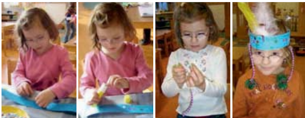
Abbildung 2: Arbeitsschritte der Werkarbeit „Indianerkopfschmuck“

In ein Portfolio passen nahezu alle „mit Geschick gemachten Arbeiten“ (=lat. Artefakte) eines Kindes die im Laufe des Kindergartenjahres erstellt wurden. Sie zeigen die Lernergebnisse (so genannte Produkte) und den Lernpfad, daher den Prozess der Kompetenzentwicklung einer bestimmten Zeitspanne auf. Dabei kann es sich sowohl um Zeichnungen, Bastelarbeiten als auch Fotografien und Audioaufnahmen der Kinder handeln. Im Wesentlichen ist es die Aufgabe des Kindes selbst zu bestimmen, welche Inhalte für das eigene Portfolio ausgewählt werden sollen. Da die Kleinsten im