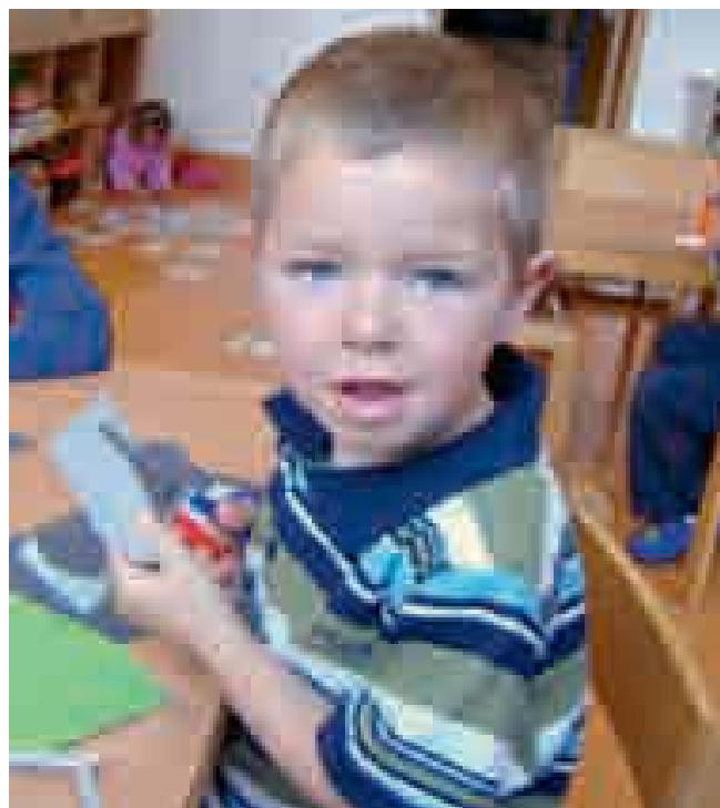
Kind mit Schere

Das Kind kann beispielsweise mit einer Schere Bilder und Figuren ausschneiden, lustige Fingerspiele zeigen und mit kleinem Spielmaterial Muster legen – Perlenbild.