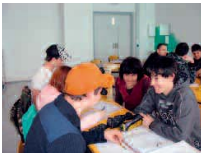
Gemeinsames Lernen steht bei Lehrlingen hoch im Kurs

Jede Lernplattform, so auch das Lern-Wiki, schafft einen Lernraum, der durch Struktur und Content mitbestimmt, was gelernt wird, welche Kompetenzen gefördert werden und welche nicht, ob Lernen Spaß macht oder als belastend empfunden wird. Die Technik setzt Bedingungen für die kognitive, emotionale und soziale Entwicklung. Wenn man erwartet, dass die Menschen die digitalen Informationssysteme akzeptieren und in ihren Alltag integrieren, muss man sie an der Planung und, soweit möglich, an der Konstruktion sowie an der Evaluation der Lernmedien beteiligen. Dies soll ein Plädoyer für eine partizipative Technikentwicklung sein, die bereits in der Phase der Konzeption der Plattform beginnen kann. In dem hier vorgestellten Projekt wurden die Lehrer im Rahmen einer Bedarfsanalyse nach ihren Unterrichtsmethoden und Wünschen an das digitale Lernprogramm gefragt; SchülerInnen nach ihrem Selbstverständnis als Lernende, nach der bisherigen Art und Weise des Wissenserwerbs und ebenfalls nach ihren Erwartungen an das Lernprogramm. Beide Gruppen partizipierten bei der Festlegung der Strukturen des Lernprogramms und bei der Entwicklung des Contents und