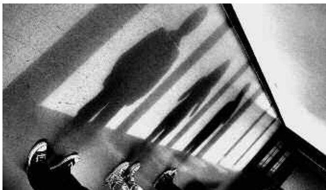
Abb. 24, 25: „Schattenfotografien zum IMST-Projekt „Umbra docet. Der Schatten lehrt?“