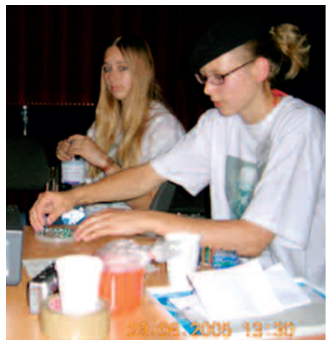
Abb. 7: Projektion von Experimenten am Overheadprojektor – Visualisierung von Schülergedichten mit Farbe

Wahrnehmung ist dem Menschen angeboren, muss aber auch erlernt werden, um sich in dieser Welt zurechtzufinden. Sobald wir uns in einer Situation sicher fühlen,