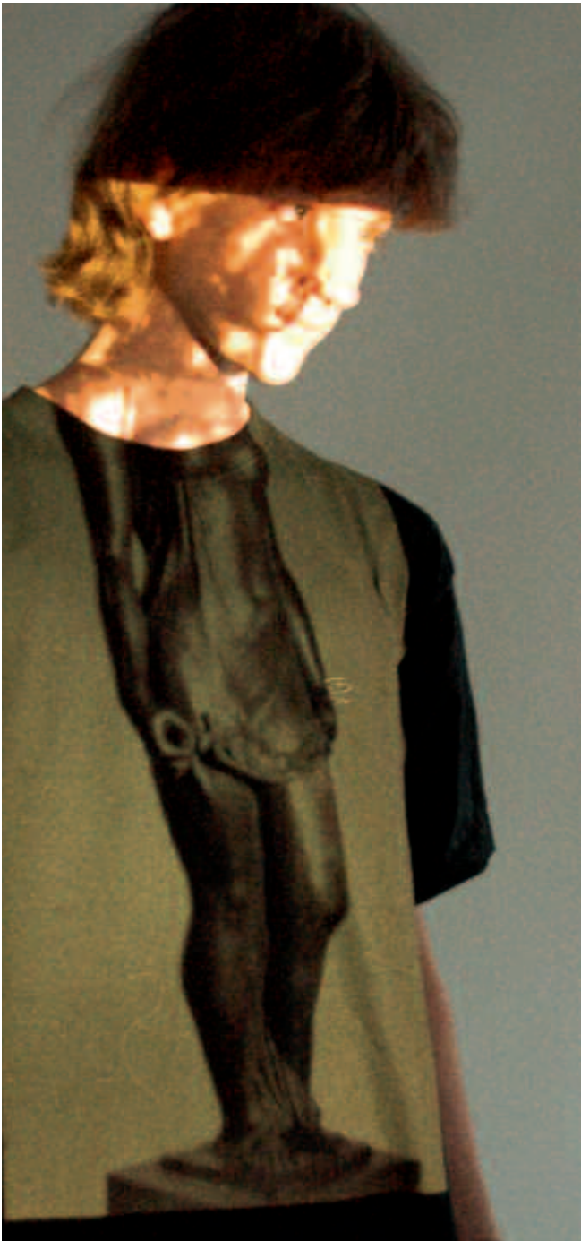
Abb. 3, 4: Diaprojektion von Kunstwerken: „Schüler/innen sind im Bild“

Im Gegensatz zu verbalen Informations- und Kommunikationsmöglichkeiten bieten visuelle Formen ihre Bestandteile (Linien, Formen, Farben, Proportionen etc.) gleichzeitig dar und werden quasi in einem Akt des Sehens erfasst. Sie eignen sich besonders für den Ausdruck von Ideen, sind konkreter als abstrakte Worte und können räumliche Perspektiven vermitteln. Während Sprache und Schrift in ihrer Linearität auf semantische Eindeutigkeit zielen, bleibt die Bedeutung von Bildern bei der Informationsvermittlung aufgrund der Simultaneität auf verschiedenen Ebenen offen.