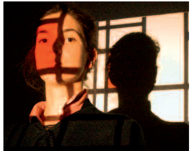
Abb. 3, 4: Diaprojektion von Kunstwerken: „Schüler/innen sind im Bild“