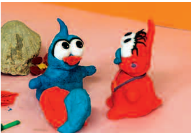
Abb. 20, 21: „Wuggels in Love“, 2004/05: Knetanimation

Medienprojekte mit Schwerpunkt Fotografie und/oder Film bieten in besonderem Maß Gelegenheit, individuelle und kollektive Entfaltung zu fördern, wobei dem