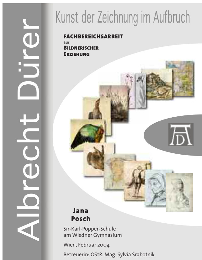
Abb. 12: Titelblatt zur Fachbereichsarbeit „Kunst der Zeichnung im Aufbruch“