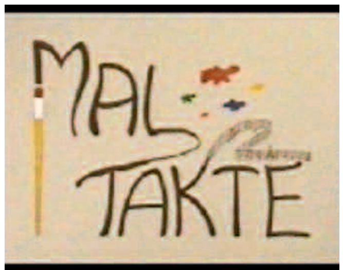
Abb. 14–15: „Maltakte“, 1996/97 – multimediale Interaktion mit Bildprojektionen am Overheadprojektor und zu musikalischen Impulsen der Mitschüler/innen