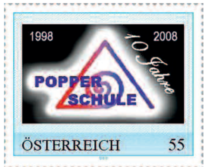
Abb. 2: Sondermarke zum Schuljubiläum