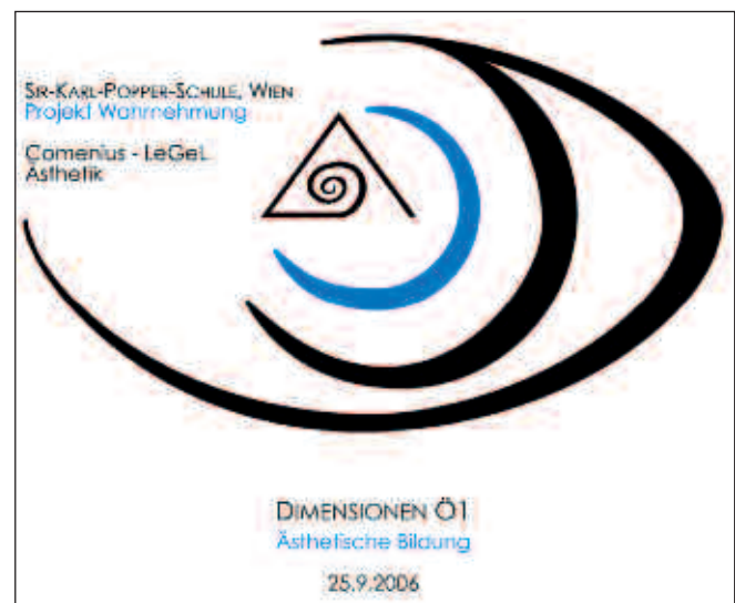
Abb. 1: Label für CD-Rom „Ästhetik“

Inhalte, welche die menschliche Wahrnehmung im Allgemeinen und individuelle Sichtweisen im Besonderen hinterfragen, schließen grundlegende Kriterien einer medialen Ästhetik ein. So gehören zur Gestaltung einer CD-Rom durch Schüler/innen-Teams die Kenntnis visueller Ordnungsfaktoren sowie die optische Aufbereitung bildhafter Darstellungen von Informationen unter Berücksichtigung der Reaktionen von Rezipienten auf bestimmte visuelle Reize. Mit Hilfe von Zeichen und Symbolen zur Orientierung und interaktiven Nutzung – Icons, Buttons, verschiedenen Cursorformen, bewegten Bildern u. v. m. – werden dem Benutzer einer CD-Rom zahlreiche Schnittstellen angeboten, wobei Einfachheit