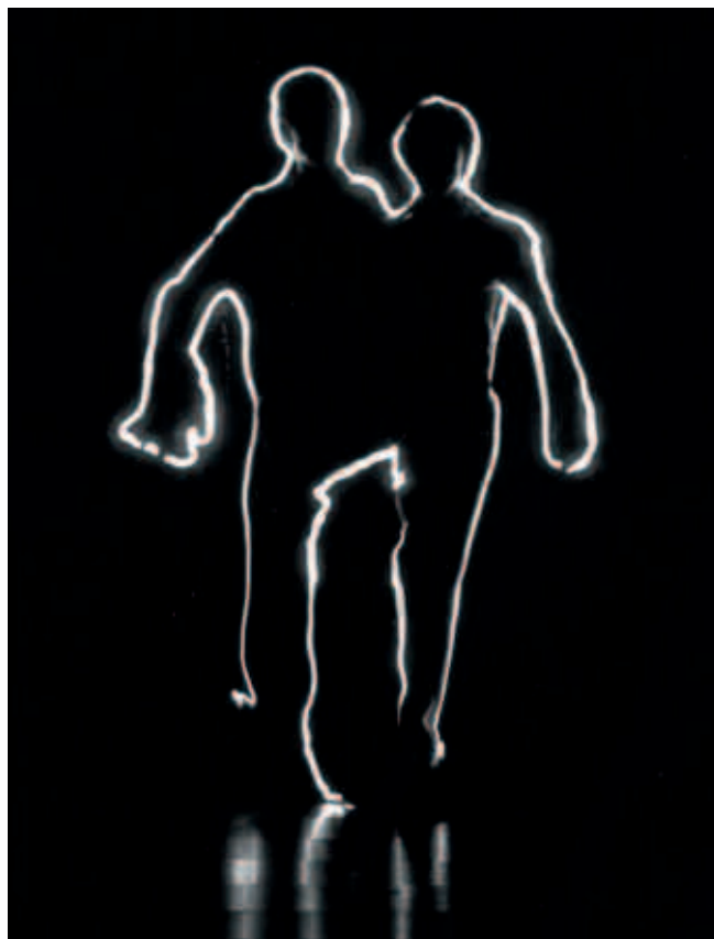
Abb. 8, 9: Luminogramme – fotografische Aufzeichnung von Bewegungsspuren mit Licht

Auf der Grundlage von Reizungen der Sinneszellen und von eigenem Handeln finden wir ein Modell der Welt , unsere „Wirklichkeit“. Gegenstände reflektieren in unterschiedlicher Weise Licht, als dessen Projektion im Auge das Netzhautbild entsteht. Dieses strukturierte Licht stört die einzelnen Sehzellen, welche die Reize an das Gehirn weitermelden. Dort wird die Wahrnehmung der Welt in binäre Signale übersetzt, welche Neurophysiologen als Klick-Klick hörbar machen können. Je intensiver