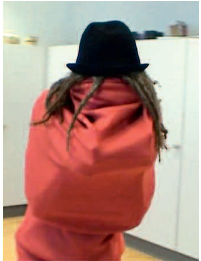
Abb. 5, 6: Experimente mit Körperhüllen

Im Gegensatz zu verbalen Informations- und Kommunikationsmöglichkeiten bieten visuelle Formen ihre Bestandteile (Linien, Formen, Farben, Proportionen etc.) gleichzeitig dar und werden quasi in einem Akt des Sehens erfasst. Sie eignen sich besonders für den Ausdruck von Ideen, sind konkreter als abstrakte Worte und können räumliche Perspektiven vermitteln. Während Sprache und Schrift in ihrer Linearität auf semantische Eindeutigkeit zielen, bleibt die Bedeutung von Bildern bei der Informationsvermittlung aufgrund der Simultaneität auf verschiedenen Ebenen offen.