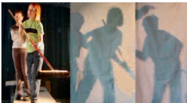
Abb. 17, 18: „Kunst aus der Dose“, 2001/02: Dokumentarfilm eines Graffiti-Projekts zur Gestaltung von Garderobewänden