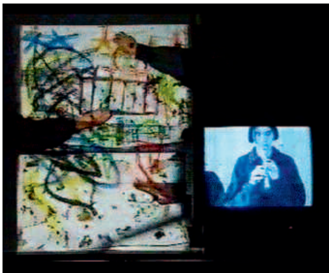
Abb 16: „Im Rampenlicht von Pieter Bruegel, d. Ä.“, 1999/2000: Mediale Schattenspiele als Mittel der Kunstrezeption