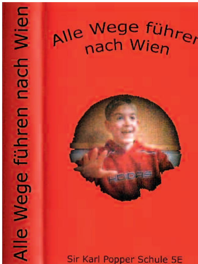
Abb. 19: „Alle Wege führen nach Wien“, 2002/03: Digitaler Spielfilm

(2003/04), „weil das Thema interessant klingt“ und bereitete es freiwillig als filmische Präsentation auf. Zur Einstimmung in das ernste Thema wird der Betrachter im Vorspann mit humorvollen Einlagen ins Mittelalter versetzt. Der Hauptteil – eingeleitet durch eine anachronistische Einblendung des gleichnamigen Buches – widmet sich einer genauen Analyse der elf Bilder des grafischen Zyklus.