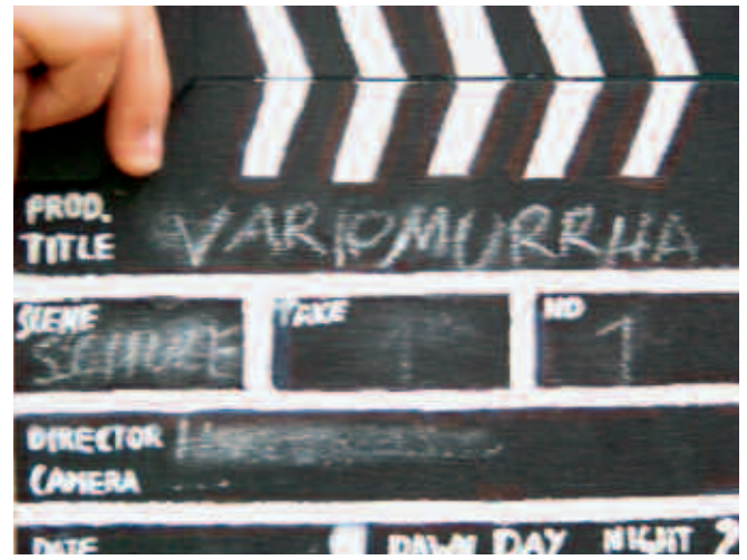
Abb. 10, 11: Making off-Fotos zu „Variomurrha“ (finnisch: Schattenmord), 5. Klasse 2008/09

Die klassischen Institutionen Familie, Peergroup und Schule verlieren zusehends an Einfluss und sind ihrerseits von Kommunikationsweisen der Medien geprägt, in denen das Bild dominant auftritt.