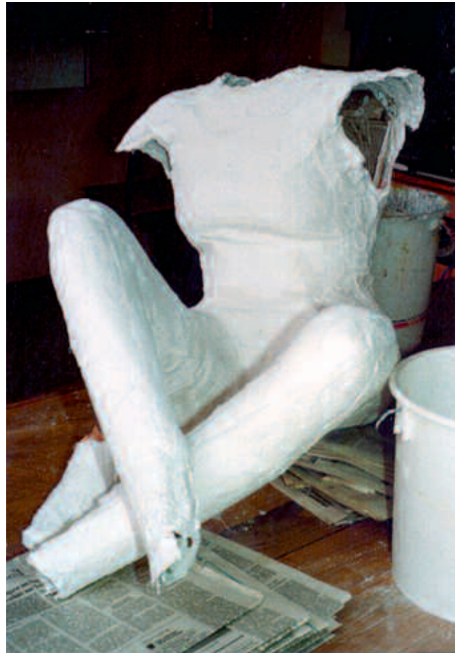
Abb. 13: „Gips Dir voll“, 1991/92 – Verbindung von Plastik mit Medien-erziehung

Aus der Themenliste für eine Unterrichtsforschung zur Druckgrafik wählte ein Schülerpaar „Ars moriendi“